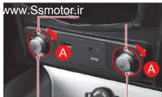
کلید گرم کن صندلی راننده